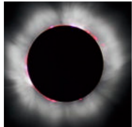
Couonne (en rouge) et chromosphère (en gris) photographiées lors de l'éclipse totale du 11 août 1999