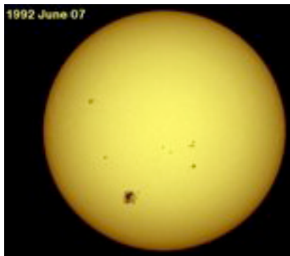
Photosphère avec une tache solaire (Wikipedia)

La partie visible du Soleil est la photosphère . C'est une couche gazeuse d'environ 300 km d'épaisseur, constamment agitée par de gigantesques cellules de convection qui lui confèrent son aspect granulé. Sa température atteint 5'500°.